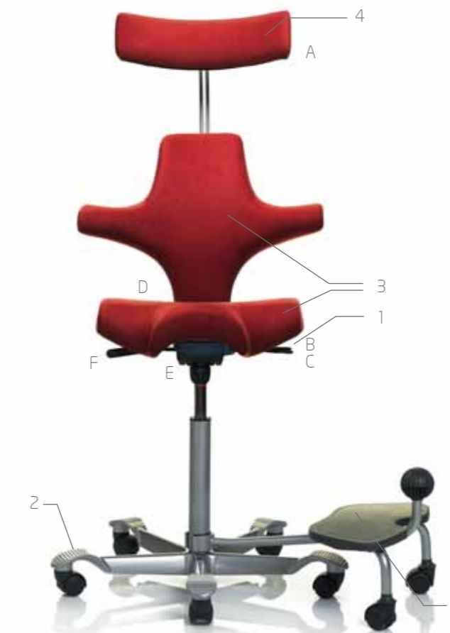
HÅG Capisco Siège Selle 8107 Design: Peter Opsvik Brevet et design déposés