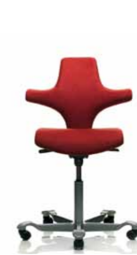
HÅG Capisco 8126