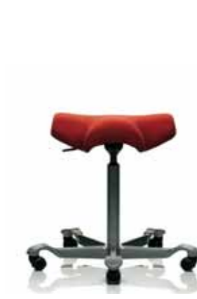
HÅG Capisco 8105 Siège Selle