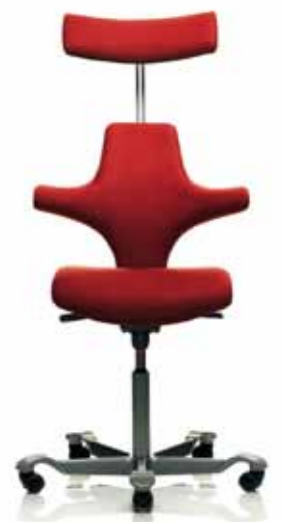
HÅG Capisco 8127