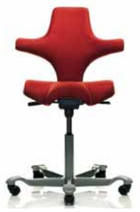
HÅG Capisco 8106 Siège Selle